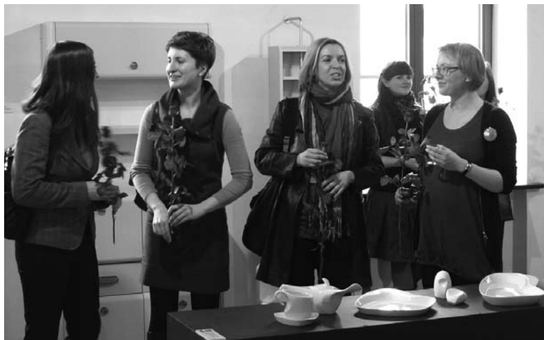
Dzień Kobiet na Zamku