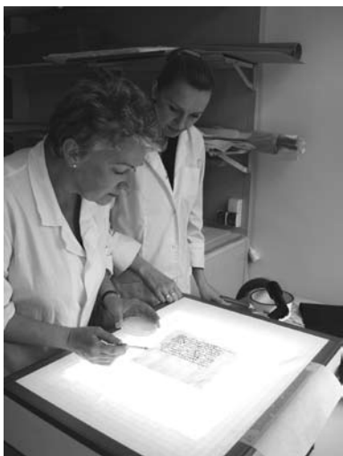
Prace konserwatorskie w Archiwum Państwowym w Katowicach, fot. Książnica