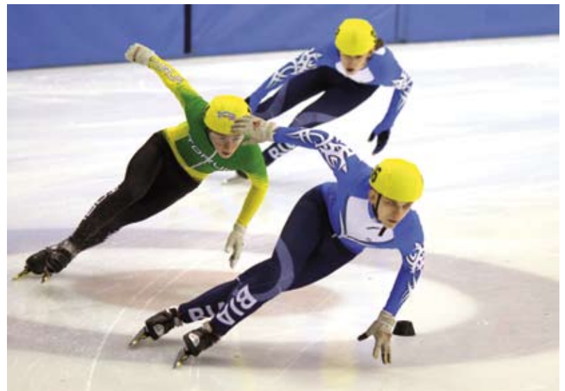
Zmagania łyżwiarzy na cieszyńskim lodowisku

Zawody w tej widowiskowej dyscyplinie zostały zorganizowane po raz pierwszy w naszym mieście,