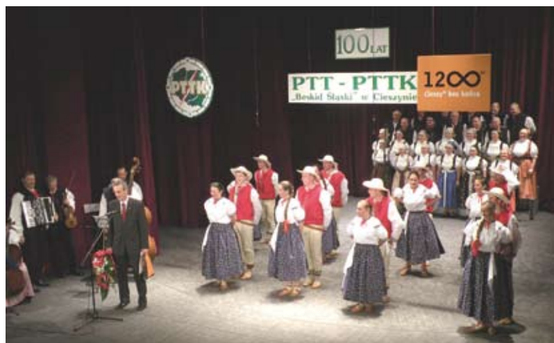
Uroczystości zakończył występ Zespołu Pieśni i Tańca Ziemi Cieszyńskiej