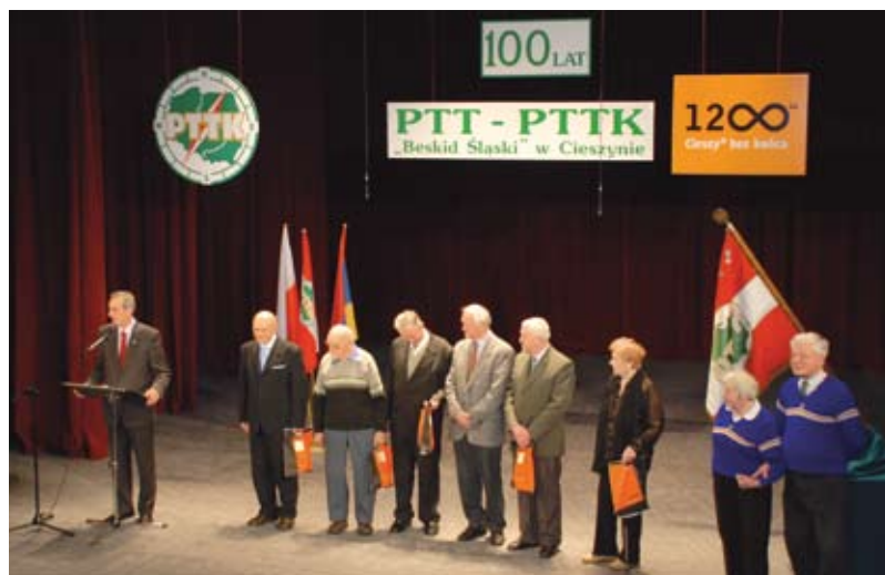
Nestorzy cieszyńskiego Oddziału PTTK